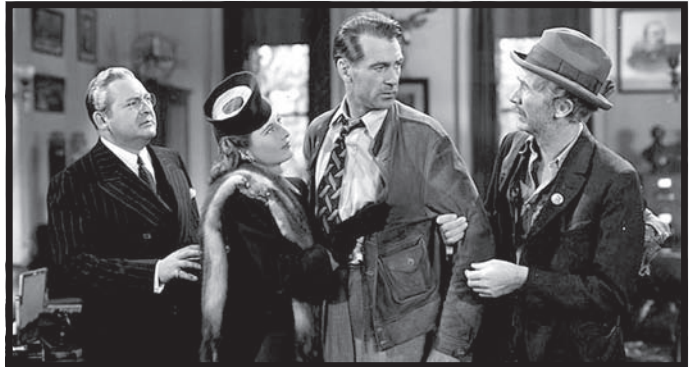
با جان دو ملاقات کن

کنند، با وجود آن که به لحاظ ساختار کلاسیک فیلمنامه‌ای نمی‌توان ایرادهای چندانی را متوجه آنها دانست، اما به لحاظ فلسفه فرامتنی‌شان مسلماً قابل باور نخواهد بود که آدمی ساده‌دل و ناپخته در موقعیتی بحرانی، خطیر و پرمسئولیت قرار گیرد و تنها با تکیه بر راستی و صداقت و نیز ایمان خلل‌ناپذیر خود بتواند بر همه موارد غلبه کند و همگان را نیز تحت تأثیر قرار دهد. چنین چیزی در فضای واقعی اجتماعی پذیرفتنی نیست یا دست کم می‌توان گفت نادر است، اما کاپرا و تیم نویسنده او و به خصوص رابرت راسکین تعلق خاطر