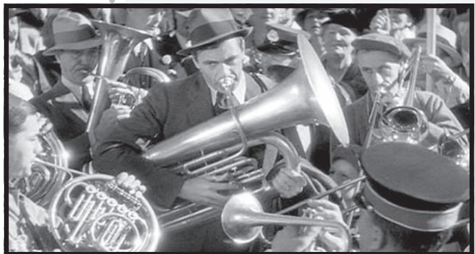
آقای دینز به شهر می‌رود

عجیبی به این تم داشتند. آنها از همان اولین همکاری‌شان، جنون آمریکایی (۱۹۳۲)، قهرمان ایده‌آل‌گرای خود را (با بازی والتر هیوستون) در برابر بانکداران رذل و نفرت‌انگیز که فاقد خصوصیت‌های اخلاقی و انسانی بودند، قرار دادند و همین موقعیت نمایشی را با انواع داستان‌ها و میزانشن‌های مختلف تا زمان آخرین فیلم مشترکشان که بازسازی مجدد یکی از نخستین کارهایشان با نام بانویی برای یک روز (۱۹۳۳) بود و کاپرا آن را با عنوان معجزه سیب یا جیبی